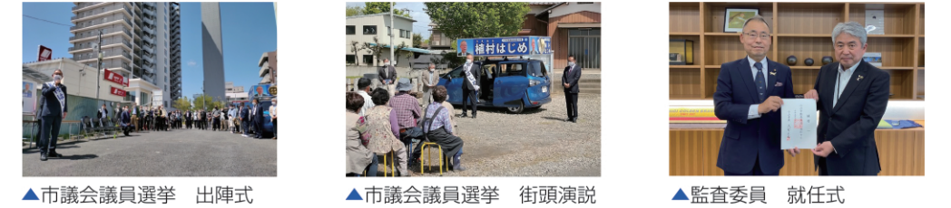
▲市議会議員選挙 出陣式 ▲市議会議員選挙 街頭演説 ▲監査委員 就任式

令和5年4月 小山市議会議員選挙 4期目の当選 皆さまからのご支援 ありがとうございます。 令和5年5月 議会選出の監査委員に就任 5月16日の臨時議会で議員選出の監査委員に選任され全会一致で承認されました。